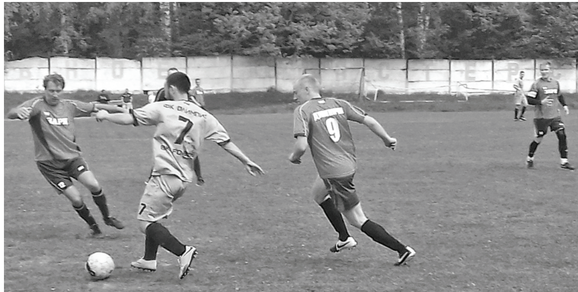
На встречных курсах.

12 мая думиничский стадион «Центральный» принимал матч 1/8 Кубка области по футболу. Встречались «Заря» и калужский «Олимпик». Игра была такой острой, интересной, и так понравилась болельщикам, что стоит рассказать о ней подробно.