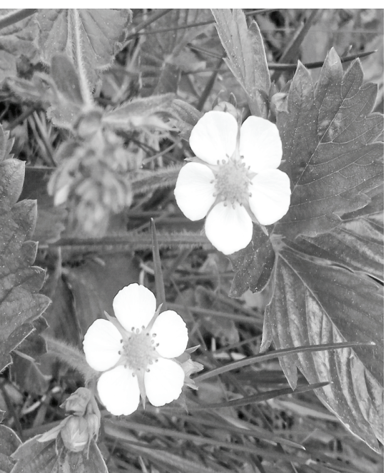
Май. Стадон. Земляника цветет.

НИКА-ТВ 6.00, 10.00, 12.00 Новости 6.10 «ЗА ДВУМЯ ЗАЦАМИ» 7.50 Мультифильм 8.05 «Часовой» 12+ 8.35 «Здоровье» 16+ 9.40 «Неруливые заметки» 12+ 10.15 «Галдина Польских. По семейным обстоятельствам» 16+ 6.10 «В ДОВРЬИ ЧАС!» 8.05 «Фактор жизни» 12+ 8.35 «Петровка, 38» 8.50 «СИЦИЛИАНСКАЯ ЗАЩИТА» 10.35 «Александр Абдулов. Роман с жизнью» 11.30, 00.10 События 11.45 «ТРИ ДНЯ НА ЛЮБОВЬ» 13.45 «Смех с доставкой на дом» 12+ 14.30 «Московская неделя» 15.00 «Советские мафии. Демон престоюлки» 16+ 15.55 «Дикие денги. Отари Квантришвили» 16+ 16.40 «Прошание Ялончых» 16+ 17.35 «ПУЛТЫ ДЛЯ ПЛОШКИ» 21.15, 00.25 «ГЕНЬ СТРЕКОЗЫ» 1.20 «ЛЮБОВЬ В КВАДРАТЕ» 3.15 «НА ПЕРЕГУТЬЕ»