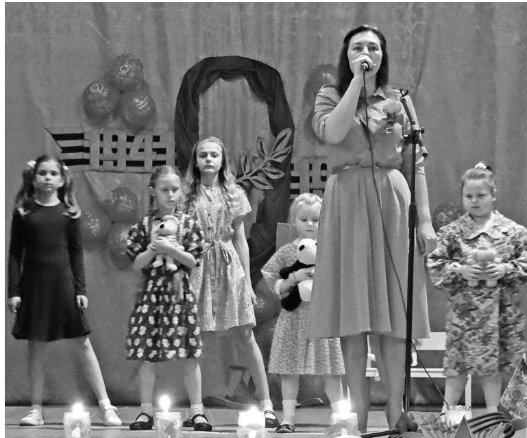
9 мая. Станция Думиничи.

Гостям очень понравился мемориал, который содержится в хорошем состоянии, они говори-