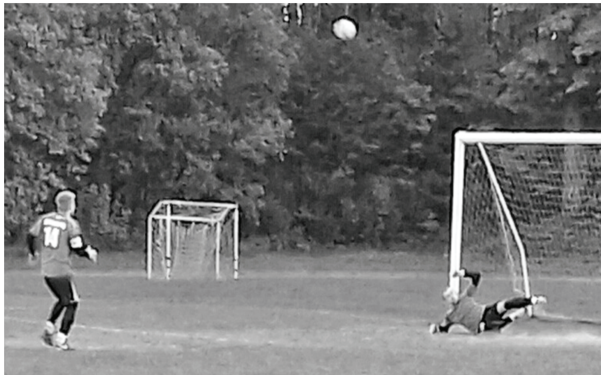
Незабитый пенальти «Зари». Мяч врезался в перекладину и отскочил как пробка.